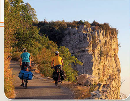
Conception / Réalisation cartographique : MOGOMA 2019 Rédaction / coordination : Inspiration Vercors Route de Paudès